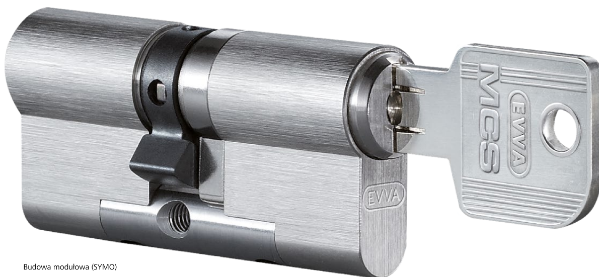
Budowa modułowa (SYMO)